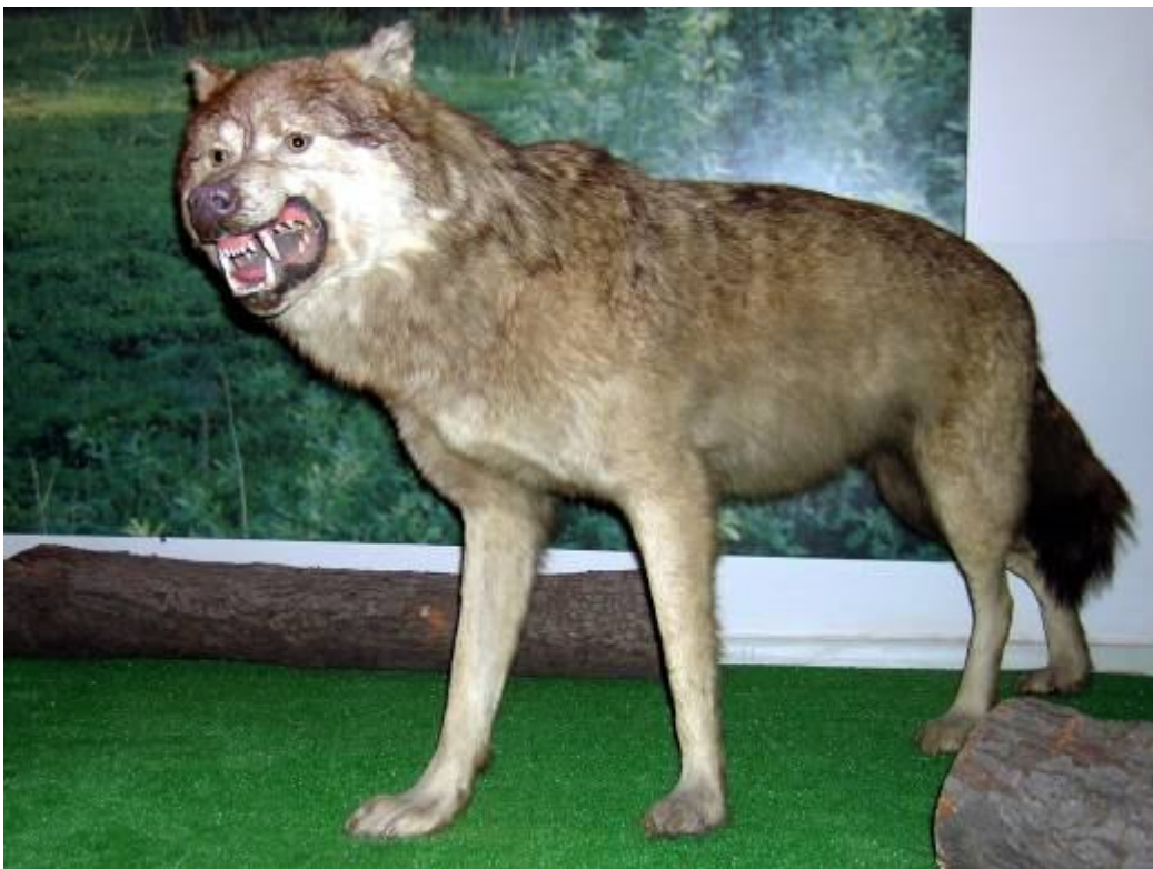
Фото 11. Столовая дворца великого князя Н.Н.Романова в с.Першине. Фоторепродукция из книги Д.П. Вальцова «Першинская охота», слева хорошо видно чучело волка.