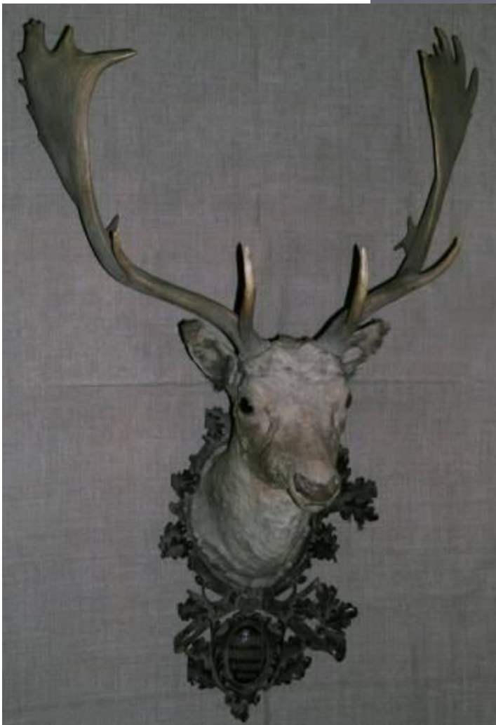
Фото 13. Медальон с чучелом головы самца лани.